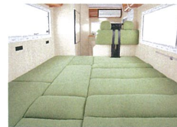
リビングはシートをフルフラットにしてゴロゴロくつろいだり、ベッドルームとしても使えるタイプもある