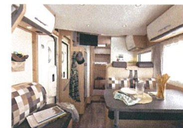
車はすべてAT車なので運転がラク。車内はオゾン殺菌装置で除菌・消臭が徹底されていて安心