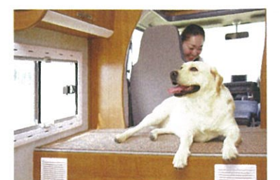
ペットの犬も乗車できる専用車両があり、愛犬家も気兼ねなく一緒に旅ができる(台数限定)